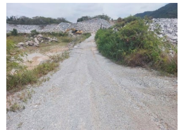
เส้นทางขนส่งแร่ระหว่างหน้าเหมือง-โรงโม่หิน