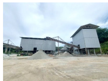
พื้นที่โรงโม่หินของโครงการ