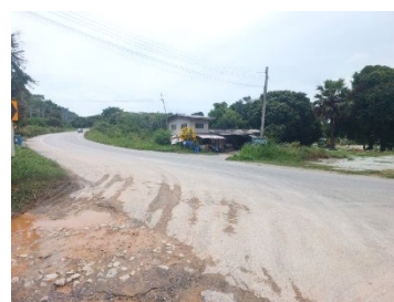
ทางหลวงหมายเลข 3144